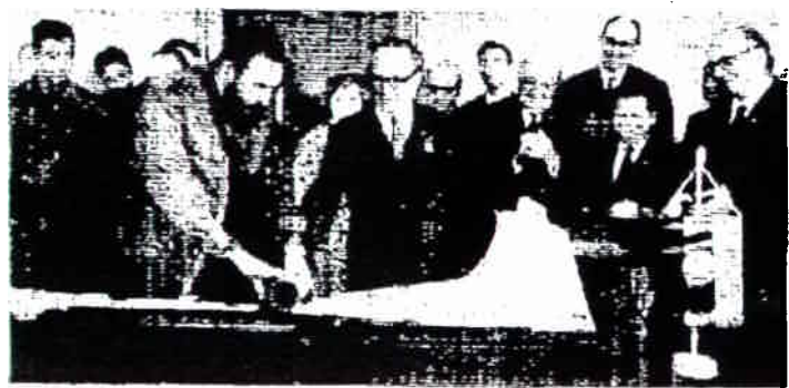
Fidel Castro zeigt Erich Honecker die Karte der Ernst-Thälmann-Insel.