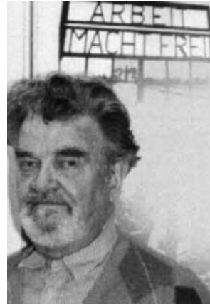
Ex-Häftling Junge 1994