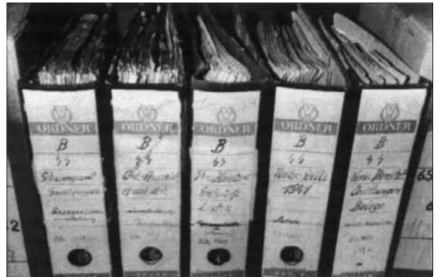
NS-Unterlagen der Stasi: Aktion „Licht“

zum Totschlag der Prozeß gemacht werden. Er floh in die DDR.