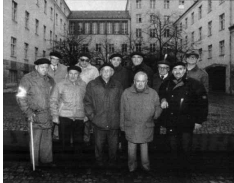
Ehemalige Sachsenhausen-Häftlinge*: Stasi wußte Bescheid