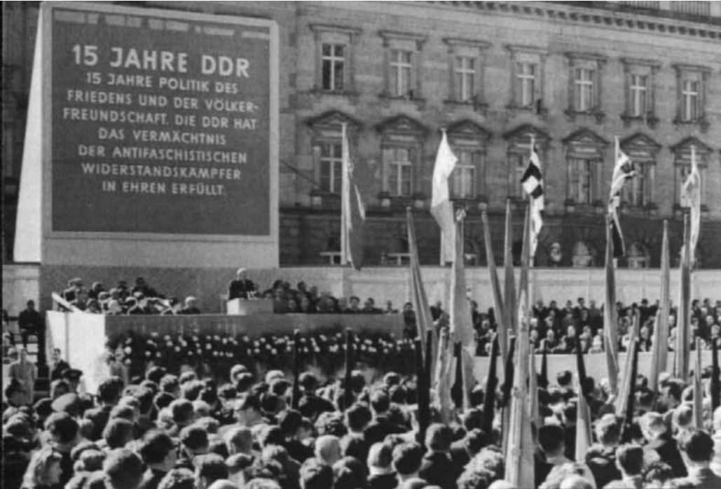
Antifaschistische Kundgebung in Ost-Berlin (1964): Jeder vierte Genosse ein Nazi