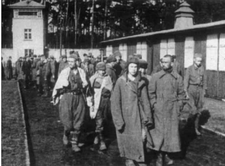
Sowjetische Kriegsgefangene in Sachsenhausen (1943) Die Wächter blieben unbehelligt

1968 ließ Mielke für die Alt-Nazis in Ost und West ein eigenes Stasi-Archiv einrichten. Dessen Aufgabe unter anderem: die in „Westdeutschland im Staats-, Wirtschafts- und Militärappa-